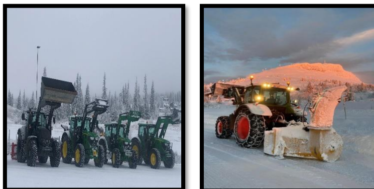
Brøyteavtale ble tildelt Skei Hyttetjeneste i perioden 2024-2027

femten (15) cm snø siden forrige brøyting på et tidligere tidspunkt enn den påfølgende onsdagen, så skal det brøytes på alle gårds plasser umiddelbart.