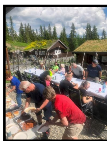
God innsats i alle arbeidslagene som jobbet på dugnaden

Etter arbeidsøkten var det grilling og trivelig, sosialt samvær for de fremmøtte som virkelig hadde gjort seg fortjent til mat og drikke.